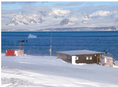
Česká antarktická stanice Johanna Gregora Mendela, ležící při pobřeží průlivu Prince Gustava, s Antarktickým poloostrovem v pozadí