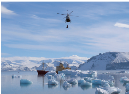
Materiál pro stavbu stanice J. G. Mendela přivezl chilský vojenský ledoborec Almirante Oscar Viel v únoru 2005